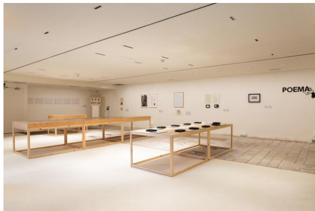
La planta de baix , amb la instal·lació Anotaciones para una eiségesis , de Marla Jacarilla, dins l'edició PostBrossa 20.