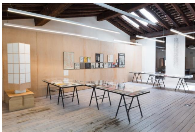
L' altell amb el muntatge La xarxa al bosc. Joan Brossa i la poesia experimental, 1946-1980.