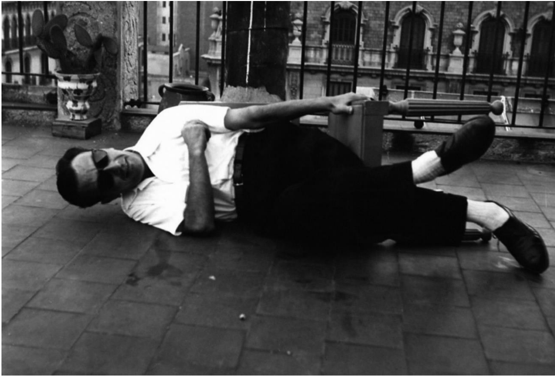
Joan Brossa, fotografiat per Roman Ferrer, al terrat de casa als anys cinquanta.

una peça sonora, un poema transitable, un objecte, una partitura, una escenografia, o tot alhora. Les propostes que s'hi vagin presentant, doncs, mutaran l'espai i donaran una nova dimensió a la creació brossiana des de la contemporaneïtat.