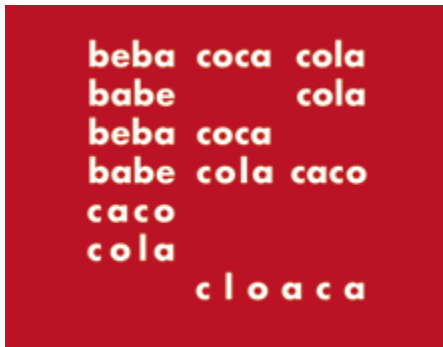
Beba coca-cola (1957), Décio Pignatari