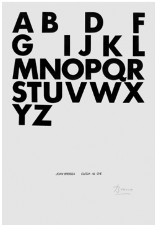
Elegia al Che (1967), Joan Brossa