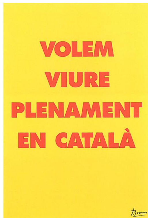
Cartell "Volem viure plenament en català", 1997