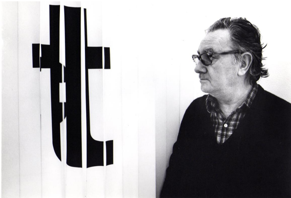
Joan Brossa a la Galeria Prats, 1982.

Per a més informació sobre el poeta consulteu el web de la Fundació Joan Brossa: www.fundaciojoanbrossa.cat